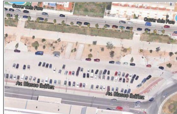
Centro de Salud de Corea